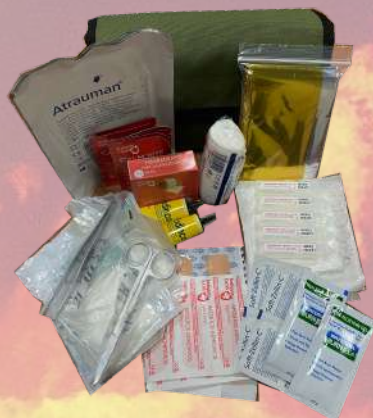
↓ Botiquín ignífugo BO9256