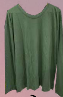
↙ Camiseta ignífuga M/L