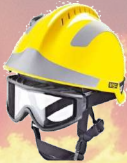
↙ Casco F2 EXTREM c/gafas incluidas