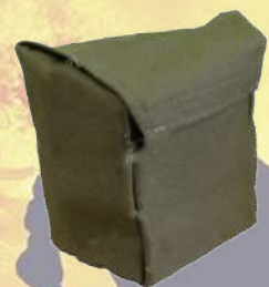
↙ Funda ignífuga para máscara y filtros

*Los filtros se pueden colocar juntos o ambos por separado