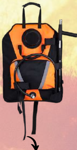
Mochila extintora VFT 20L naranja