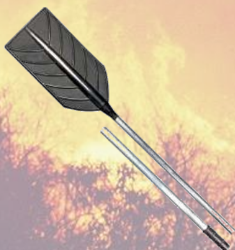
↓ Batefuegos desmontable