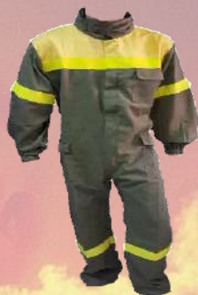
↙ Buzo ignífugo cat. II con reflectante bicolor