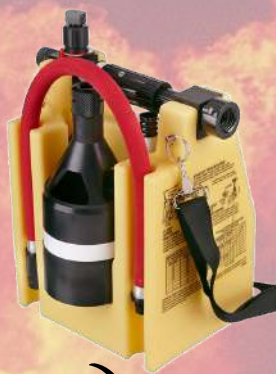
Mochila extintora PROPAK