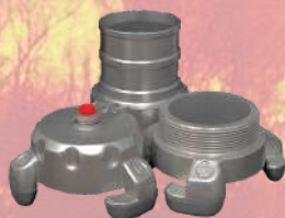
↓ Racor de manguera