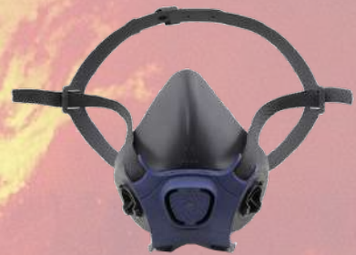
↙ Máscara MOLDEX 7002