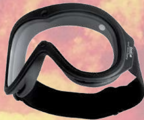
↙ Gafa Bolle CHRONOSOFT II