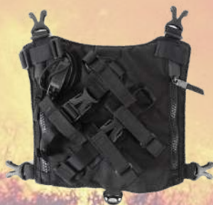
Chaleco porta radios DIMATEX