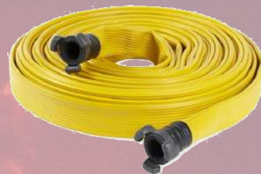
↓ Manguera GOMDUR 25mm- de tramo 20m 45mm- de tramo 15m 70mm- de tramo 10m