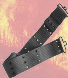
↙ Cinturón forestal con agujeros