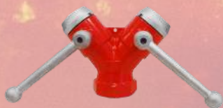
↓ Bifurcación de manguera 45mm