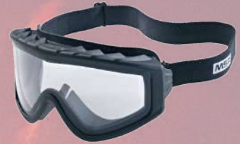
↙ Gafa RESPONDER