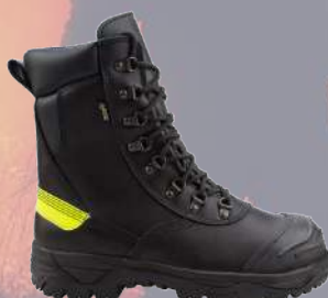
↙ Bota FAL Forester Goretex