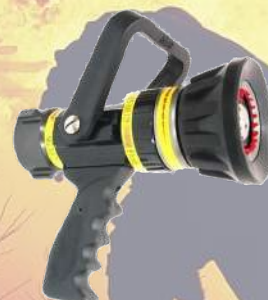
↓ Lanza SG540 25 Ø