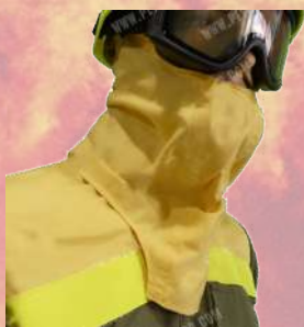
↙ Protector de cuello cat. II amarillo