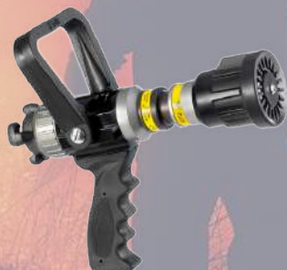
↓ Lanza 25 Ø VIPER STI 30 PV