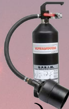
Extintor por espuma UPRIM