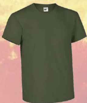
↙ Camiseta algodón M/C