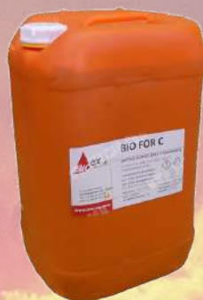
↓ Espumógeno Bio for C