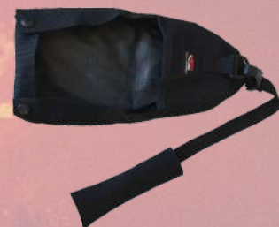
Funda herramienta multi-función GORGUI