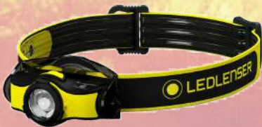
↙ Linterna cabeza led frontal IH5