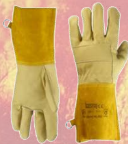
↙ Guante piel ignífugo 104-FV/ HI