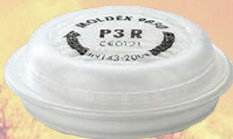
↙ Filtro P3R MOLDEX