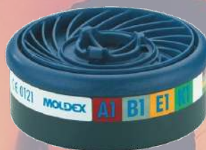
↙ Filtro A1B1E1K1 MOLDEX 9400