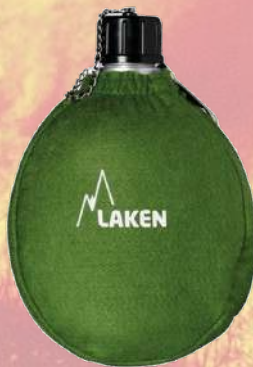
Cantimplora LAKEN verde 1L 121