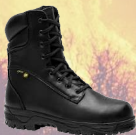
↙ Bota FAL Extinción Top Goretex