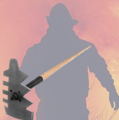
Herramienta multi-función GORGUI CLASSIC