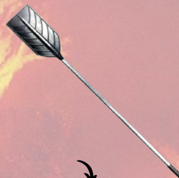
↓ Batefuegos con mango de aluminio